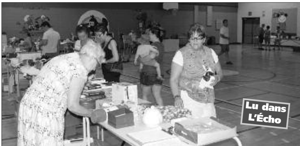
Les visiteurs firent d'intéressantes trouvailles.