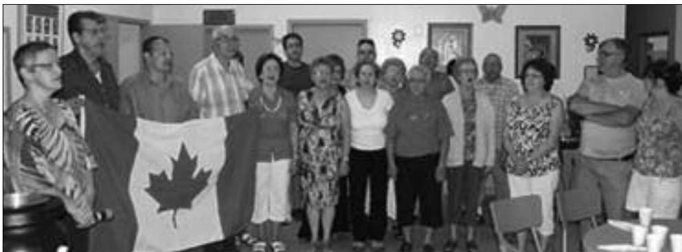
Des membres du conseil et la chorale Les Voix de la Mer, chantaient l'hymne national.

L a municipalité de Bas-Caraquet invitait, le 1er juillet dernier, toute sa population à un brunch au Club de l'âge d'or, pour célébrer la Fête du Canada.