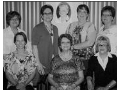
Les fondatrices du groupe Action Revivre.

Action Revivre remercie sincèrement tous les donateurs pour leur grande générosité et