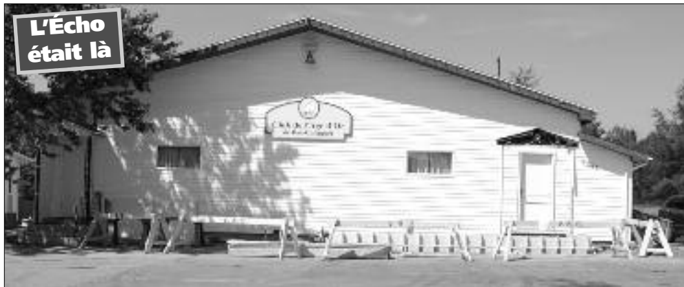
L'entrée du local de l'âge d'or en rénovation.

L' édifice du Club de l'âge d'or de Bas-Caraquet subit présentement des modifications qui ajouteront une rampe d'accès pour les chaises roulantes et qui permettra l'accès de plain-pied. Les travaux ont débuté le 10 juillet dernier sous la direction de M. Aubé LeBouthillier. Une demande d'un don de 10000 $ sera faite à la Caisse populaire Acadie afin d'aider à la construction de cette rampe.