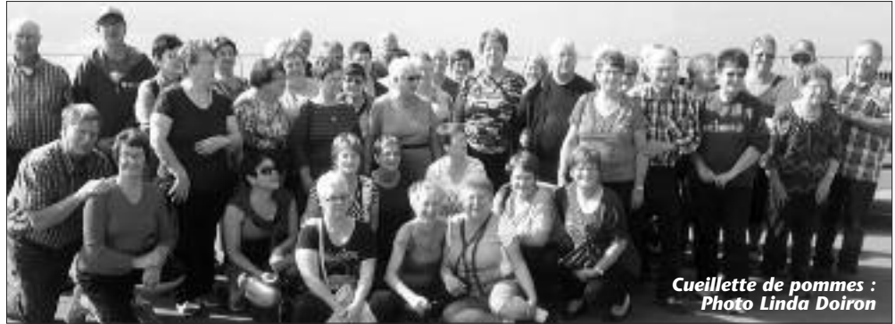
Cueillette de pommes : Photo Linda Doiron

Le 23 octobre le gros lot sera de 4366 $ plus 50% des ventes. Jusqu'à présent le Club a investi le gros lot initial de 1000 $ plus les dépenses d'organisation matérielle. Les