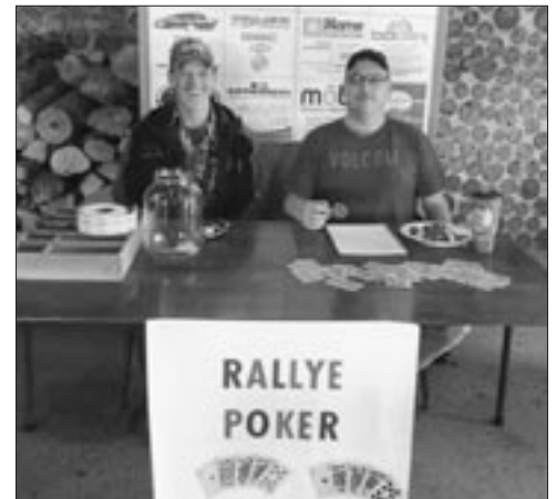
Bénévoles au travail

Le Club Chasse et Pêche de Bas-Caraquet publiait sur sa page Facebook un message ainsi que ces quelques photos suite au 40e canaval qui s'est déroulé du 13 au