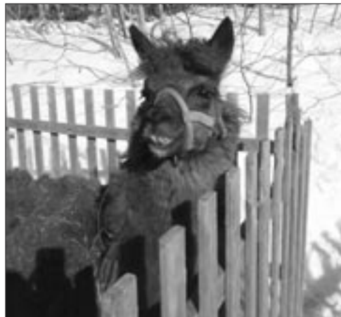
La Mini Ferme était sur place pour le plaisir des jeunes et des moins jeunes.