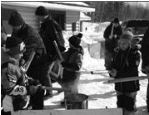
C'est le temps de se sucrer le bec!