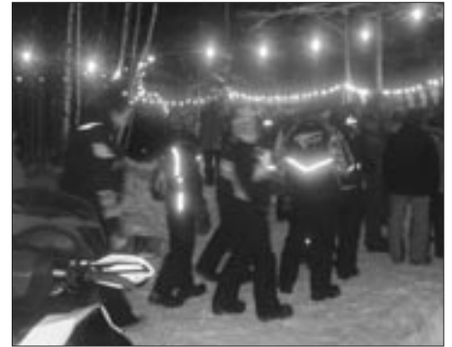
53 équipes participaient au rallye d'observation.