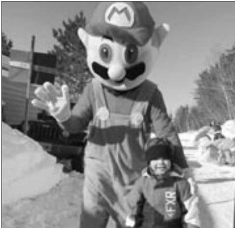
Une des mascottes en compagnie d'un petit garçon heureux.