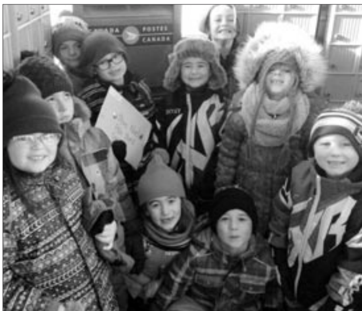
Nous envoyons nos lettres au père Noël.