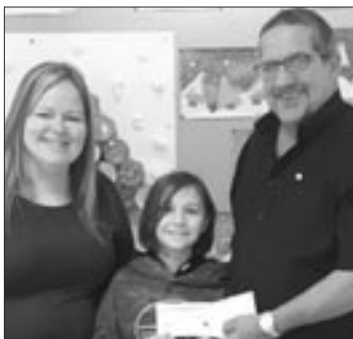
Nous avons reçu un don du Club Richelieu suite à la Journée Spaghetti.