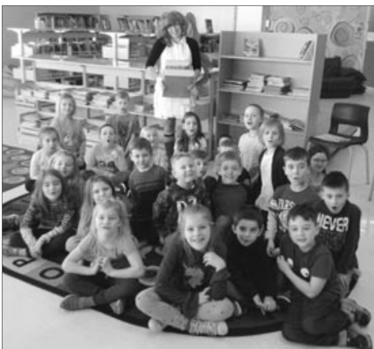
La fameuse Féélitou a rendu visite à nos élèves de la maternelle à la 2e année.