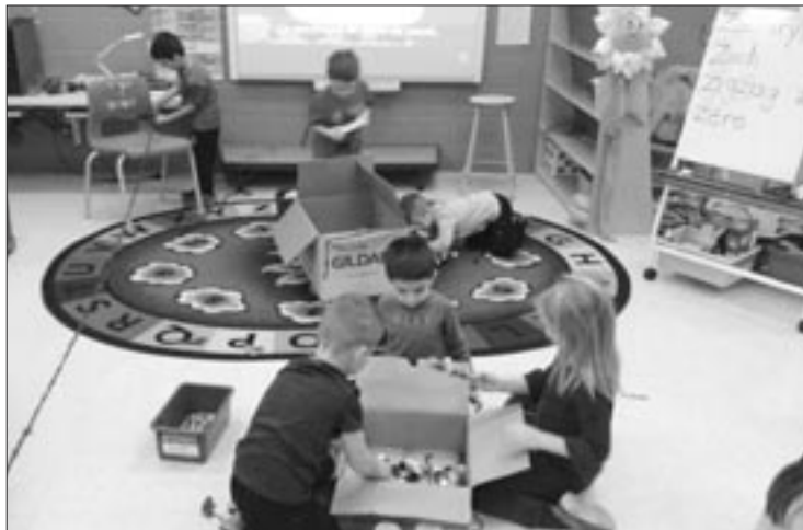
Construction des pièges à lutin. Travail d'équipe, entraide, ingéniosité, motricité et communication orale.