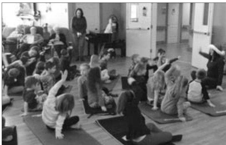
En collaboration avec Espace Croissance, les élèves de la maternelle sont allés faire du Yoga.