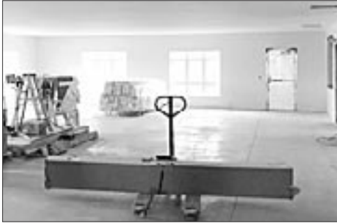
La salle communautaire