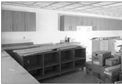
La cuisine commence à prendre forme