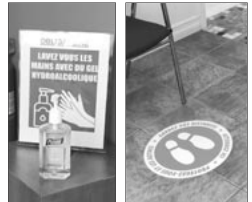
Des mesures sécuritaires ont été mises en place.

Voilà qu'avec le déconfinement, le bureau municipal de Bas-Caraquet a rouvert ses portes au public le lundi 25 mai et les employés ont réintégré leurs bureaux.