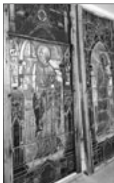
Plusieurs vitraux pour la nouvelle église sont déjà arrivés et attendent d'être installés.