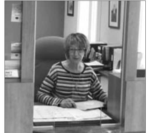
Un plexiglass a été installé à la réception.