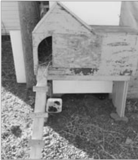
Abris pour les chats errants au quai de Bas-Caraquet.