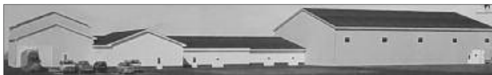
La maquette de la nouvelle usine.