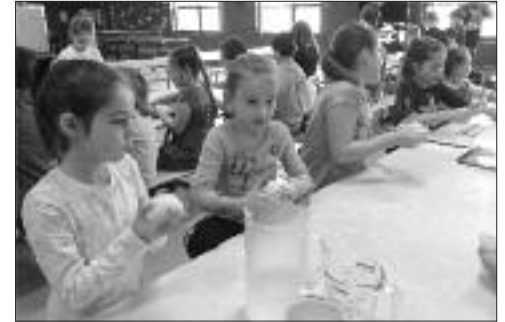
Les élèves de 1ère et 2e année font du pain.

Durant la semaine, les élèves avaient différentes activités pour bouger dont une sortie au Club Plein Air de Caraquet le lundi 23. L'école communautaire L'Escale des Jeunes désire d'ailleurs remercier le Club Plein Air de Caraquet pour leur belle initiative pour faire