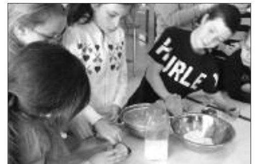
Les élèves de 3e et 4e année fabriquent du beurre.