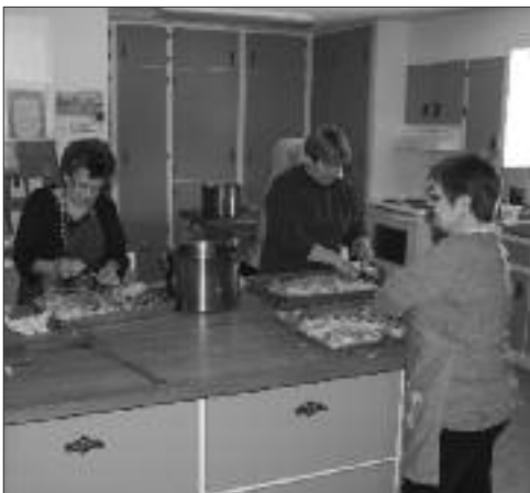
L'équipe de bénévoles au Club 50+ qui aidait à préparer les repas pour le centre d'hébergement. Des repas étaient également offerts au Club.