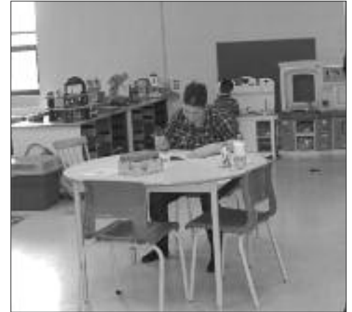
La salle de jeux pour les plus petits.