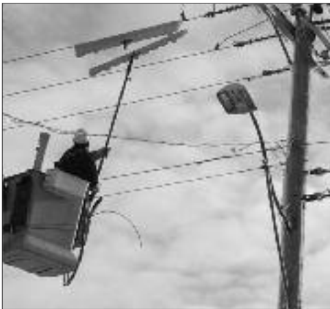
Les équipes de réparation travaillaient sans relâche.