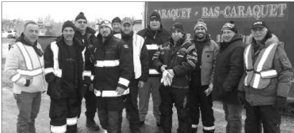
Nos pompiers qui se sont assurés de la sécurité de gens en faisant du porte-à-porte. Ils se sont occupés de la livraison de nourriture et d'eau, du bois pour le chauffage et de bien plus encore.