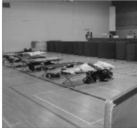
Le dortoir aménagé dans le gymnase de l'école