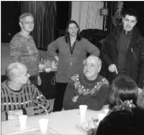
Le député d'Acadie-Bathurst, Serge Cormier rencontrait les gens à Bas-Caraquet.