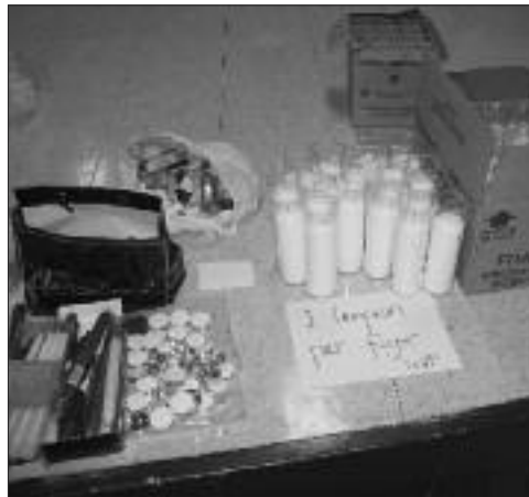
Les lampions de l'église étaient offerts en guise d'éclairage temporaire..