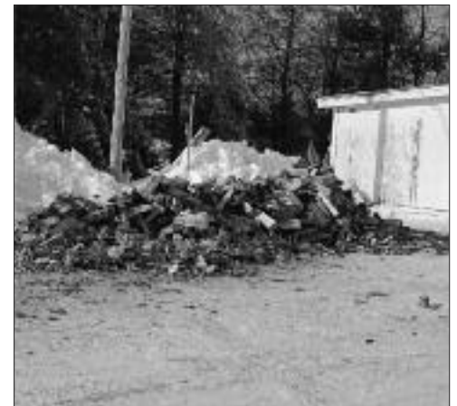
Du bois, que nos pompiers acheminaient aux maisons.