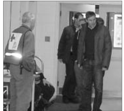
Le premier ministre Brian Gallant, par deux fois, est venu rassurer la population.