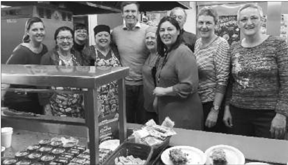
Le premier ministre Gallant, accompagné du député Hédart Albert, remerciait les bénévoles à la cuisine.