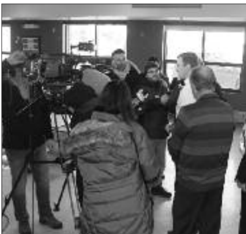
Point de presse du premier ministre à notre école.