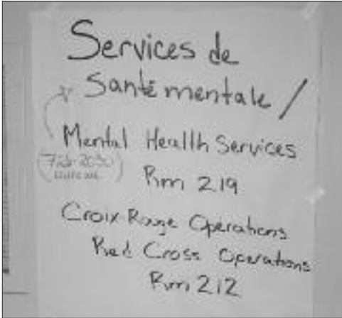
Un service de soutien psychologique était offert par la Croix-Rouge