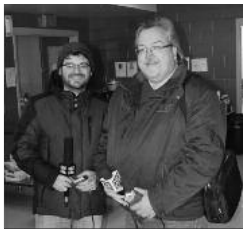
Les médias étaient là pour rencontrer les élus.