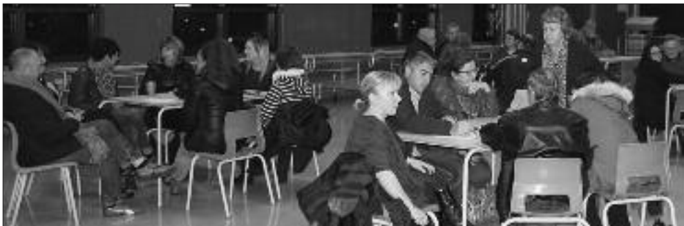
Une trentaine de personnes assistait à cette première rencontre.

L a municipalité de Bas-Caraquet invitait les citoyens à venir réfléchir et partager leurs idées en vue de la préparation du Plan