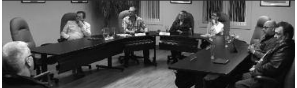
Le conseil était à l'écoute des nombreux citoyens venus s'exprimer.

Puis les élus passaient, par une première et une deuxième lecture, l'arrêté concernant la rémunération des membres du conseil. Inspiré des recommandations de l'AFMNB l'an dernier et qui proposent une grille selon la