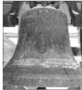
Cloche avec la vierge

Le saviez-vous? Il y a trois cloches à Bas-Caraquet dont les noms sont peu connus. Le haut du clocher de l'église St-Paul renferme trois magnifiques cloches de différentes grosseurs.