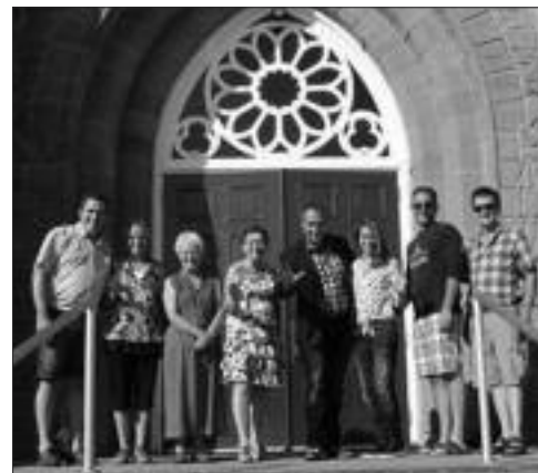
Visite de Messmer

visitait l'église en compagnie de sa conjointe et de quelques membres du comité et charmait les spectateurs le soir même au Carrefour de la mer.