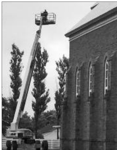
Réparations du toit

Le 29 août, le comité annonçait un don anonyme de 50 000 $ qui vient s'ajouter au montant déjà récolté (460 000 $). Une bonne nouvelle qui donne des ailes au groupe qui travaille fort pour la sauvegarde de notre patrimoine religieux.