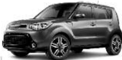
SOUL EX 2016 Modèle EX Auto 1.8i 16V

PROCES VALÉRIEN RÉCURRENTE MÉTHODE ALG INDICATEUR DE QUALITÉ CONFORME POUR UN 2 e ANNÉE CONSÉCUTIVE