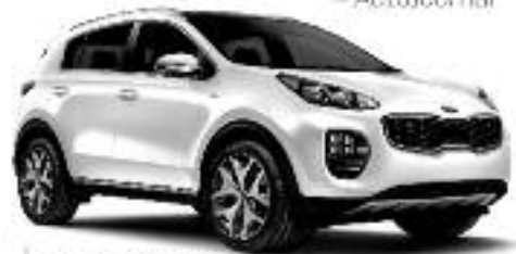
LE TOUT NOUVEAU SPORTAGE EX 2017 Modèle EX Auto 1.8i 16V

CHANGE D'ÉLÉMENTS 2016 IIHS TOP SAFETY PICK+ SÉCURITÉ ÉLEVÉE