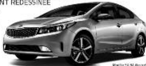
Modèle EX 1.8i 16V

LOUEZ À PARTIR DE 42$ PAR SEMAINE 0% PERDANT 48 MOIS ACCOMPTE DE 0$