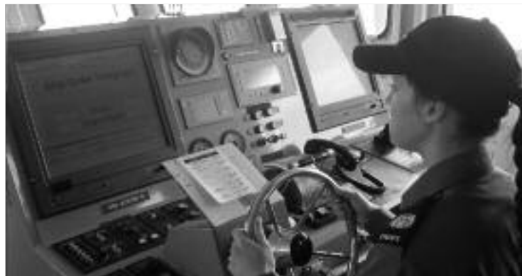
Audrey-Maryse Lanteigne au poste de pilotage.

Ces jeunes âgés de 15 à 18 ans passaient la semaine à bord de ces navires en tant que membres d'équipage, pour vivre une expérience unique en mer destinée à parfaire leurs compétences en matelotage.