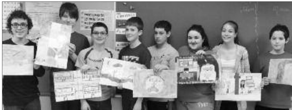
Concours d'affiche des Chevaliers de Colomb

L'école Marguerite-Bourgeoys a été tout récemment reconnue comme chef de file en matière de création d'un milieu scolaire favorable à la saine alimentation et a été mentionnée dans le « Guide des écoles du Nouveau-Brunswick où bien manger ». Une étude a été menée et l'école Marguerite-Bourgeoys est