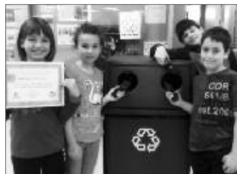
Recycle mon cell