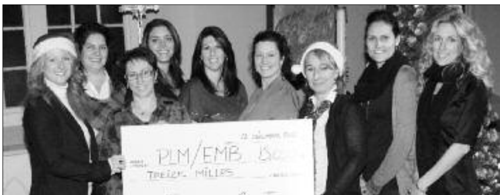
Soirée Topaze : La remise du chèque aux deux écoles.

L'équipe organisatrice de la soirée Topaze 2012 qui s'est déroulée en novembre dernier à Caraque a permis d'amasser une somme de 13000 $. L'école Marguerite-Bourgeoys et la polyvalente Louis-Mailloux se sont méritées un don de 6500 $ chacune. Le chèque leur a été remis lors du spectacle de Noël des élèves de l'école Marguerite-Bourgeoys à l'église Saint-Pierre-Aux-Liens de Caraque. Un gros Merci au comité organisateur pour cette grande générosité envers les élèves.