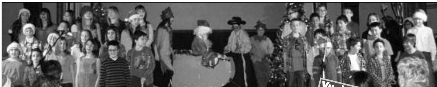
Spectacle de Noël à l'église St-Pierre-aux-Liens, le 12 décembre dernier.