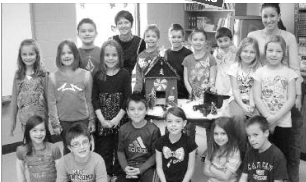
Les élèves de la classe de 2e année et leur piège à lutins.

Lors de la parade du père Noël de la ville de Caraque, le 2 décembre dernier, le comité des Leaders de l'école Marguerite-Bourgeoys a fabriqué son tout premier char allégorique. Les élèves se sont mis à la tâche pour faire partie de cette grande festivité hivernale. Ce fut une très belle soirée et les jeunes ont eu beaucoup de plaisir. Ils prévoient y participer encore l'année prochaine!