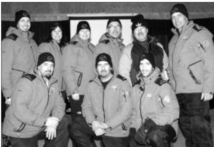
Le comité organisateur du tournoi de hockey sur étang du Lac Baker désire remercier ses généreux commanditaires.