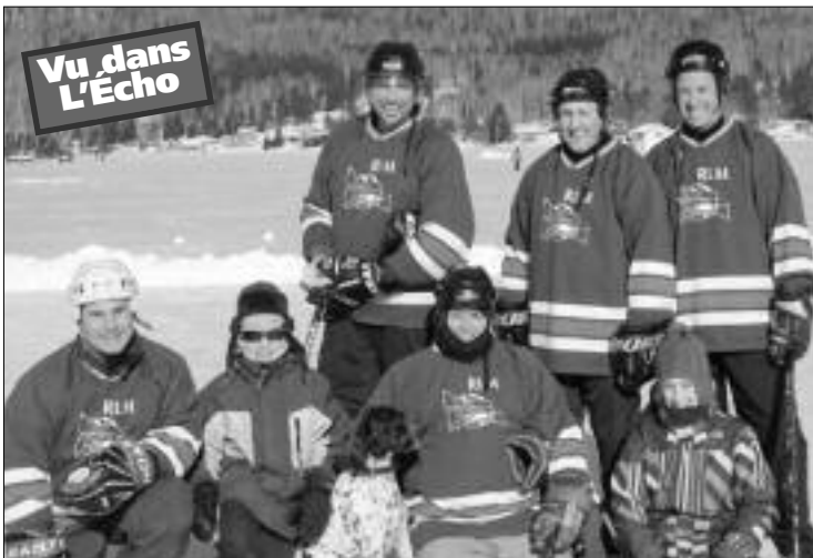
L'équipe championne de la catégorie Amicale est RLM Super Seemless. Elle a gagné la partie 19-14 contre No Name GL Machine Shop.