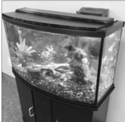
Aquarium à la bibliothèque

Le mardi 9 février à 18 h 30, il y aura une heure du conte virtuelle sur la plateforme Zoom. Pour vous inscrire, communiquer avec nous au 992-6052.