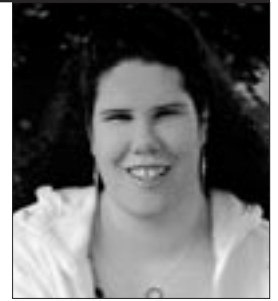
Par Marie-France Albert

Titre : Les pierres bleues Auteure : Chantal Bissonnette Publié en 2016