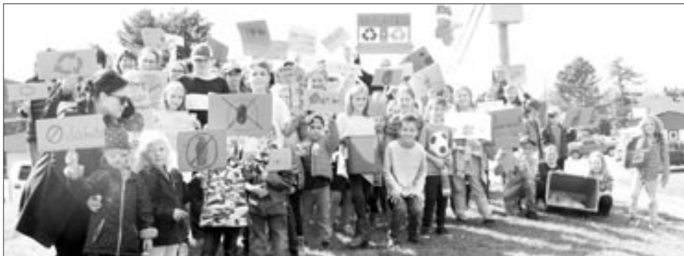
Le 27 septembre dernier, les élèves de l'école Ernest-Lang participaient à la Marche pour le climat organisée à travers le monde.