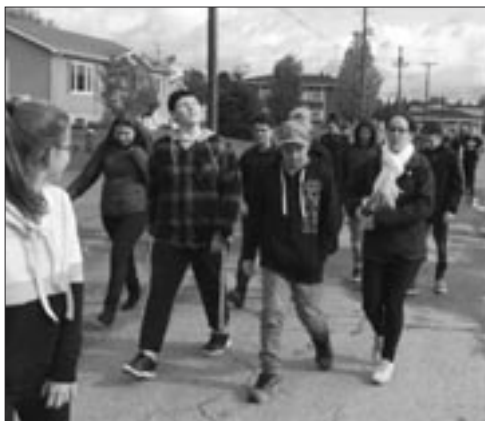
Ci-contre : Le CAHM participait également cette marche avec les élèves de la 6e-7e-8e année.