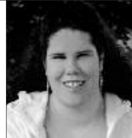
Par Marie-France Albert

Titre : Minnie Bellavance Auteure : Dominique Giroux Publié en 1992