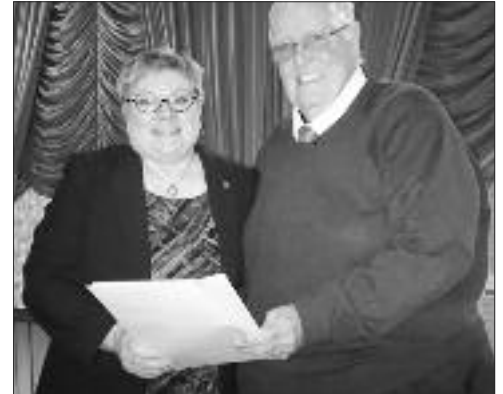
Contribution au Centre Fraternel de Clair.

La programmation complète du Festival Western de Saint-Quentin sera disponible dès avril sur le site web au www.festivalwesternnb.com . □