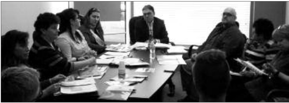
Rencontre avec la Chambre de commerce du Haut-Madawaska.