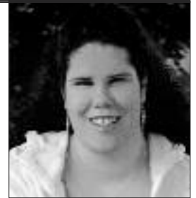
Par Marie-France Albert