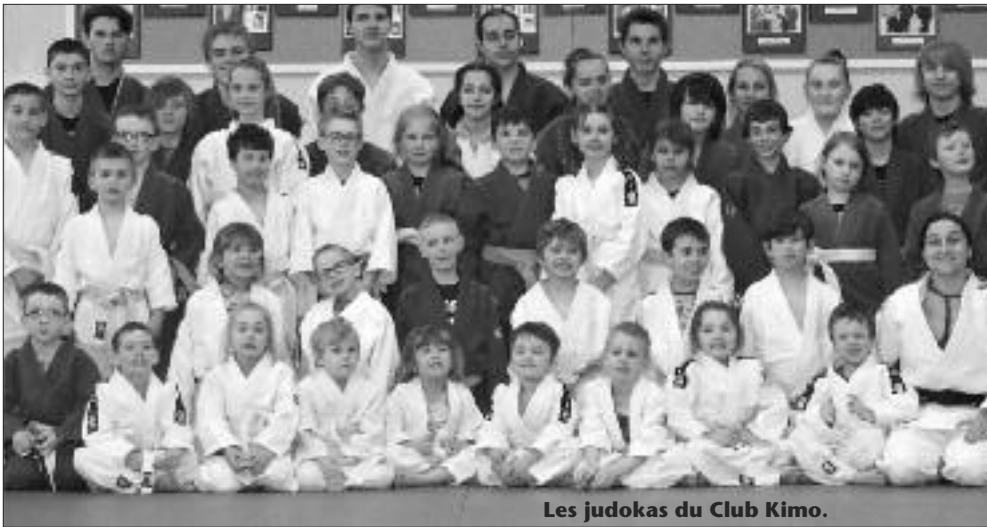
Les judokas du Club Kimo.