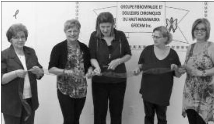
La coupe du ruban pour officialiser l'ouverture du local.