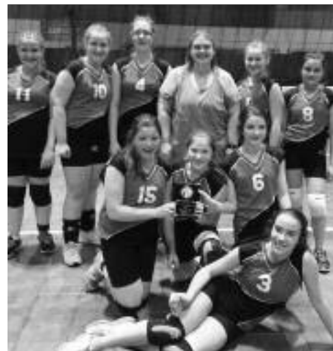
L'équipe de volleyball féminin de l'école Ernest-Lang.

Le 2-3-4 mai dernier, l'équipe participait à un tournoi à l'Université de Moncton à Moncton. Durant la ronde préliminaire, les joueuses ont affronté 3 équipes du Nouveau-Brunswick pour se classer en 4e position de leur division. Le lendemain, elles ont obtenu un bail pour la demi-finale. Elles ont joué contre le Carrefour de la Jeunesse. Après une victoire de chaque côté, elles ont joué une 3e partie avec détermination et ont remporté. En finale, elles ont joué contre l'équipe Saint-Joseph 2 dans notre région. Les filles ont persévéré, joué ensemble, collaboré pour ainsi remporter le tournoi (division jaune) à Moncton. De vraies CHAMPIONNES! ☐