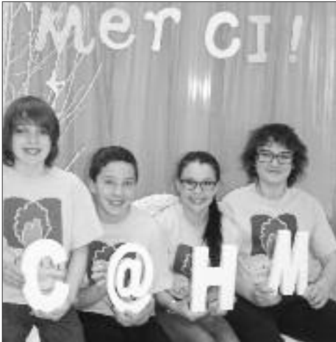
MERCI, au nom de tous les élèves du Centre d'Apprentissage du Haut-Madawaska de Clair.