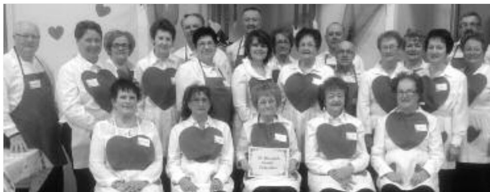
Les membres du comité organisateur et les bénévoles du 10e Brunch de la Saint-Valentin des anciennes et anciens de l'Hôpital et C.S.C. de Lamèque.

Cette année, l'objectif de la campagne a été fixé à 50 000 $, ce qui permettra de répondre aux besoins définis par les responsables de l'Hôpital et CSC de Lamèque. Les pièces d'équipement qui seront achetées et les projets qui seront mis en œuvre seront axés sur la