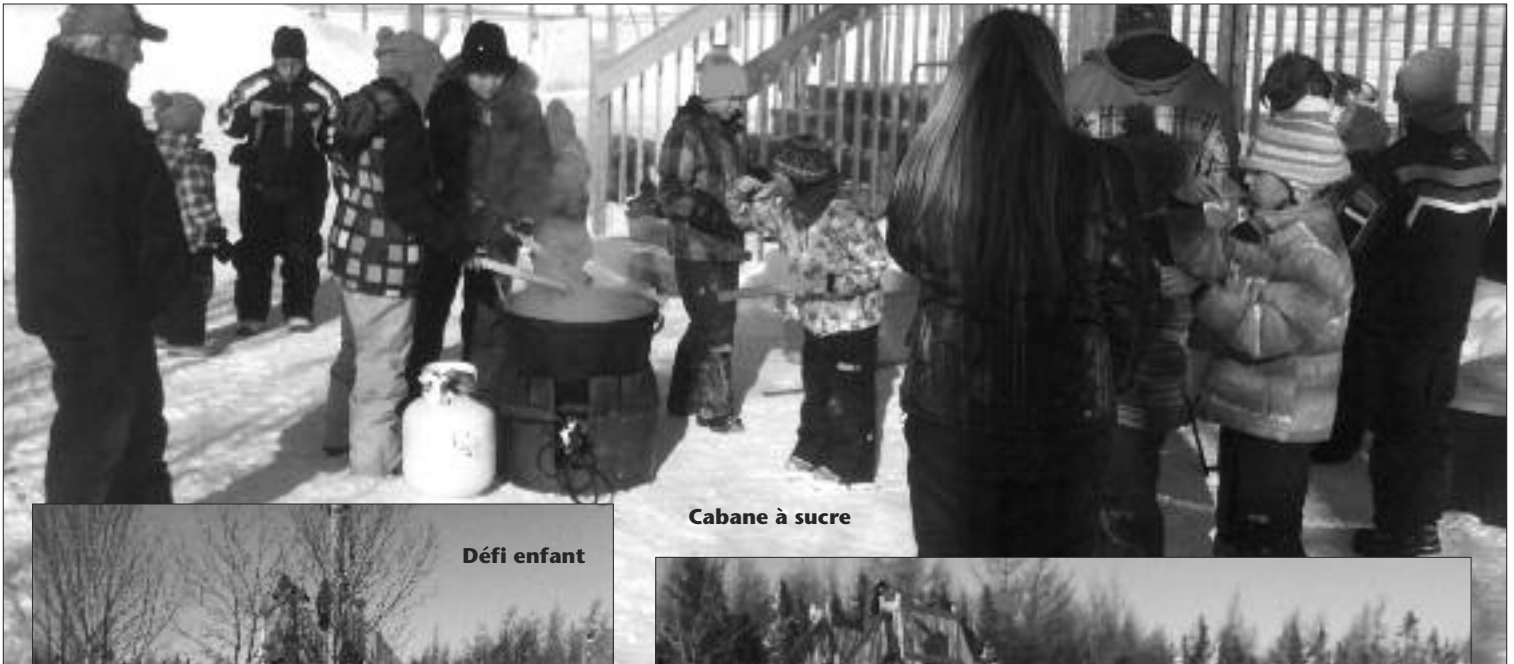
Cabane à sucre