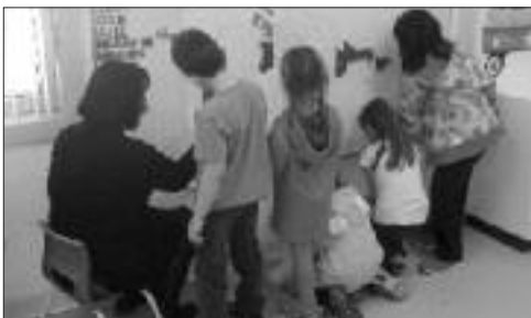
Les élèves de 1ère année en pleine création.

Dans le cadre de la semaine du patrimoine, les élèves de la maternelle à la 5e année ont