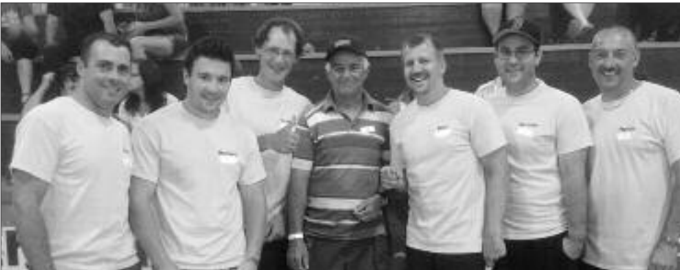
L'équipe de la ville Lamèque au Défi Tourbi.