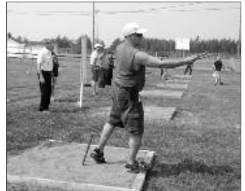
Et hop, un lancer de fer à cheval!