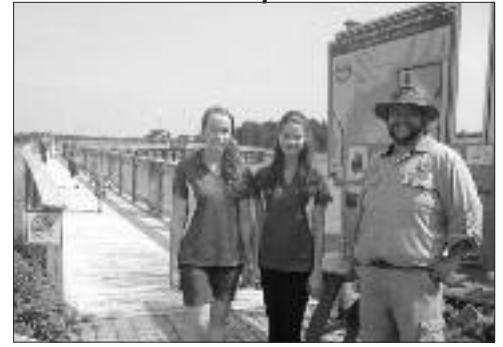
Un rallye familial avait lieu au Parc écologique de la Péninsule acadienne. Le rallye portait sur l'environnement et les écosystèmes de la région.