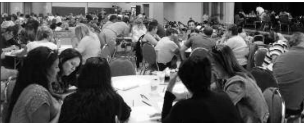
44 équipes ont participé au Rallye Tropical au profit du baseball mineur.