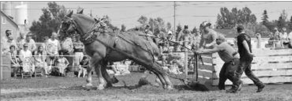
Le Hallage de chevaux était particulièrement spectaculaire cette année à cause des grandes chaleurs et se déroulait à l'arrière de l'aréna.