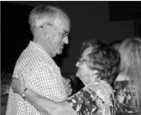
Une petite danse au Festival, rien de mieux pour se garder en forme!