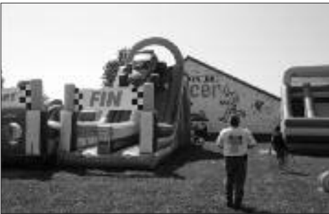
Pour la journée familiale, des jeux gonflables pour les enfants étaient sur place.