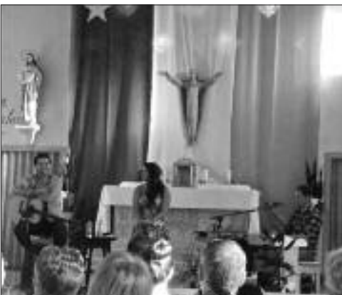
De la bonne musique à l'église Notre Dame des Flots, avec la Trappe à Homard.