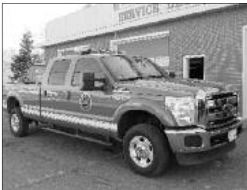
La nouvelle acquisition, un camion Ford F-350 2011.

L a Ville de Lamèque désire annoncer à ses citoyens que la brigade des pompiers volontaires s'est munie d'un tout nouveau camion Ford F-350 2011.