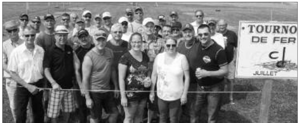
Le Fer à cheval, toujours populaire à Lamèque!!!