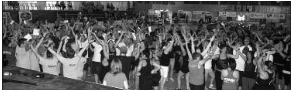
Le Défi Tourbi a réuni de nombreuses équipes à l'Aréna des Îles de Lamèque.