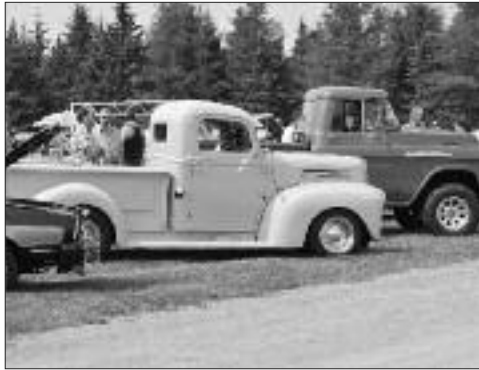
Le Car Show nous en mettait plein la vue. Des autos et encore des autos...