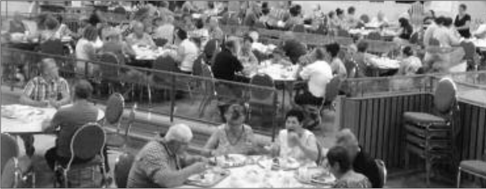
Les brunchs du Festival, organisés par des organismes locaux, une activité populaire qui a attiré les amateurs de bons déjeuners.