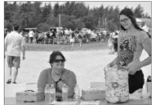
Il faisait beau et chaud pour ces bénévoles à l'oeuvre!