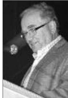
Le maire de Lamèque Réginald Paulin.