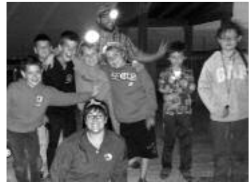
Les jeunes en compagnie des guides naturalistes.

Maximum de 10 inscriptions, Les feuilles d'inscriptions et la liste de matériel à apporter sont disponibles au Parc Écologique de la Péninsule Acadienne. Frais d'inscription de 15 $. L'enfant doit être inscrit au plus tard une semaine avant l'activité. Pour ne pas manquer cette aventure nocturne, restez au courant sur notre page Facebook à Parc écologique de la Péninsule acadienne . Pour plus d'informations, contactez le 344-3223. □