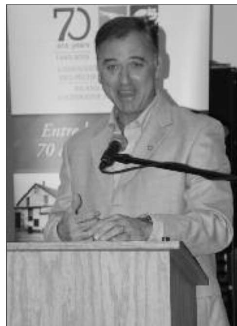
Le ministre Robichaud jubilait de plaisir suite aux annonces des deux paliers de gouvernement dans sa circonscription.

« La modernisation de notre usine de farine de poisson va nous permettre de transformer