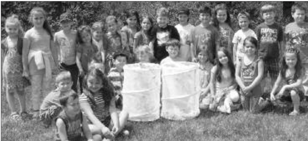
Les jeunes de maternelle laissant s'envoler leurs papillons.