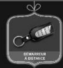
DÉMARREUR À DISTANCE