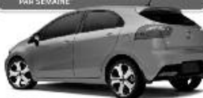
Modèle SX 3 portes ROUTE (GRANVILLE) (BN) 160 KM/1:5.3 L/100 L