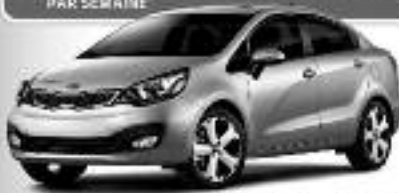
Modèle SX avec navigateur Bluetooth ROUTE (GRANVILLE) (BN) 160 KM/1:5.3 L/100 L