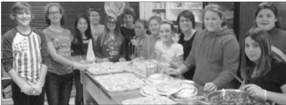
Les membres du conseil des élèves préparant les barquettes de fruits lors de la fête de l'Halloween.