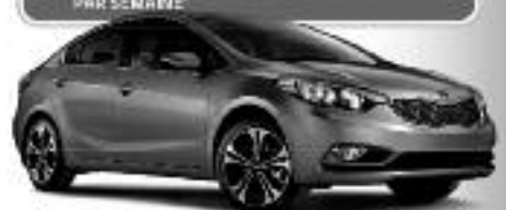
Modèle SX 3 portes ROUTE (GRANVILLE) (BN) 100 KM/1:5.3 L/100 L