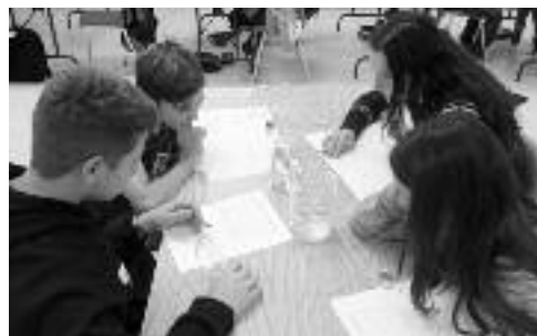
Des élèves en pleine observation

goutte de colorant dans un verre d'eau. Les élèves ont pu ressortir plusieurs nuances que nous ne remarquons pas habituellement. En second lieu, ils ont trompé une branche de céleri dans de l'eau naturelle ainsi qu'une autre dans de l'eau salée. Après quelques jours, ils ont pu remarquer une différence flagrante. Vous voulez le savoir? Nous vous invitons à tenter l'expérience à la maison! Vous serez surpris des résultats. □