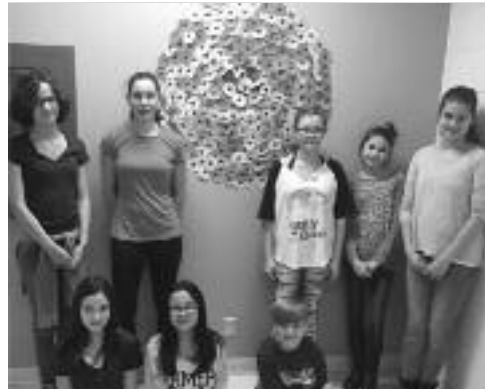
Coquelicot géant : Les membres du conseil sont fiers de ce projet.

Les élèves de 8e année de l'école communautaire Sœur-Saint-Alexandre de Lamèque ont fait quelques petites expériences dans le cadre de leur cours de science. En premier lieu, ils ont pu observer avec précision l'effet d'une