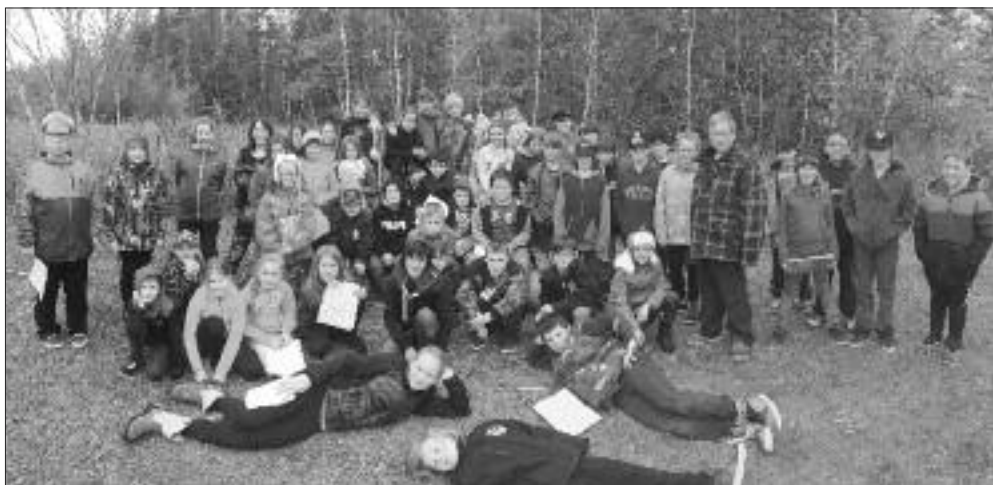
Les élèves de l'école L'Étincelle de Ste-Marie-St-Raphaël participaient au rallye avec plaisir.

Afin de permettre aux gens de la communauté de visiter nos sentiers d'Halloween, nous avons laissé les décorations en place pour une semaine supplémentaire. Nous avons également invité les écoles de Lamèque et de Sainte-Marie-Saint-Raphaël à venir faire le rallye. L'École L'Étincelle a accepté l'invitation et est venue avec une cinquantaine d'élève. □