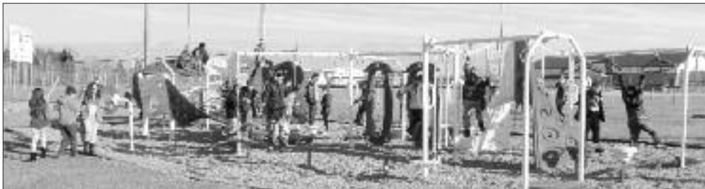
La nouvelle structure de jeux qui fait le bonheur des jeunes.