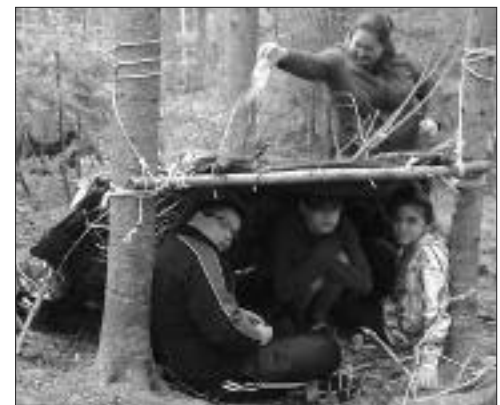
Confection d'un abris en forêt.