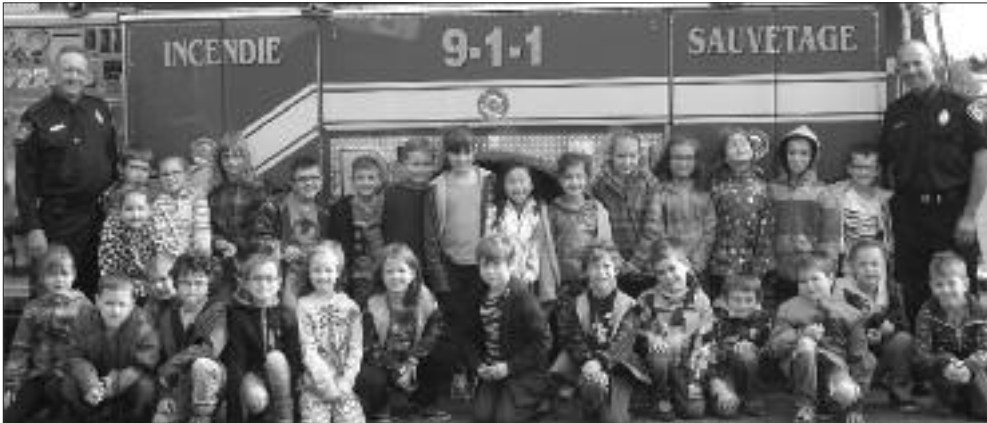
Dans le cadre de la Semaine des incendies, les pompiers de Lamèque organisaient une visite des véhicules d'urgence à l'école.