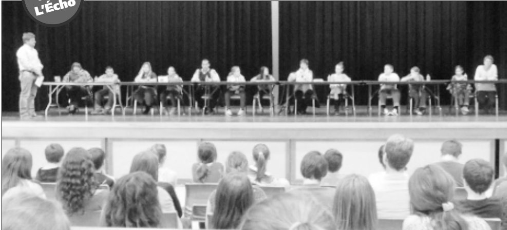
Table ronde sur l'intimidation à l'ÉSSA

Dans le cadre de sa programmation annuelle pour contrer l'intimidation, l'École communautaire Sœur-Saint-Alexandre tenait une table ronde, le vendredi 9 novembre dernier, durant