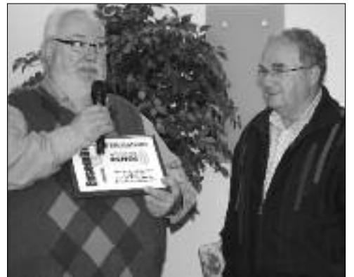
Le Réseau des Échos du Nouveau-Brunswick recevait de l'AFMNB une plaque pour ses 15 ans au service des municipalités. Le maire de Lamèque, qui a été le premier maire d'une ville à signer une entente avec le Réseau, et encore en poste, félicitait l'éditeur.

Dimanche midi, le congrès de l'Association francophone des municipalités du Nouveau-Brunswick prenait fin alors que des représentants des municipalités membres se réunissaient à Atholville-Campbellton depuis vendredi matin. Nos élus visitaient, vendredi, le Salon de l'Innovation où des fournisseurs présentaient leurs produits et services aux municipalités. □