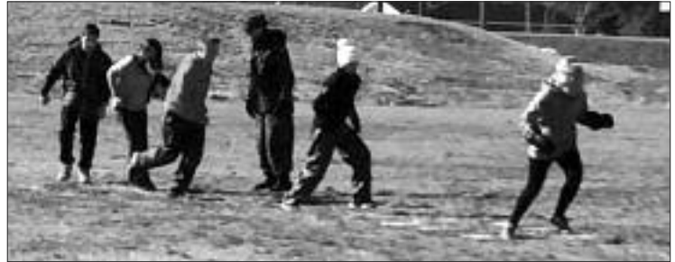
À Gagetown, des activités extérieures.

Le corps de cadets 3027 Shippagan-Lamèque-Miscou a participé à une expédition hivernale à Gagetown vers la fin février. Lors de cette fin de semaine, les cadets ont eu la chance de faire différentes activités avec le corps de cadets 1242 Petit-Rocher et le corps de cadets 3006 Dieppe.