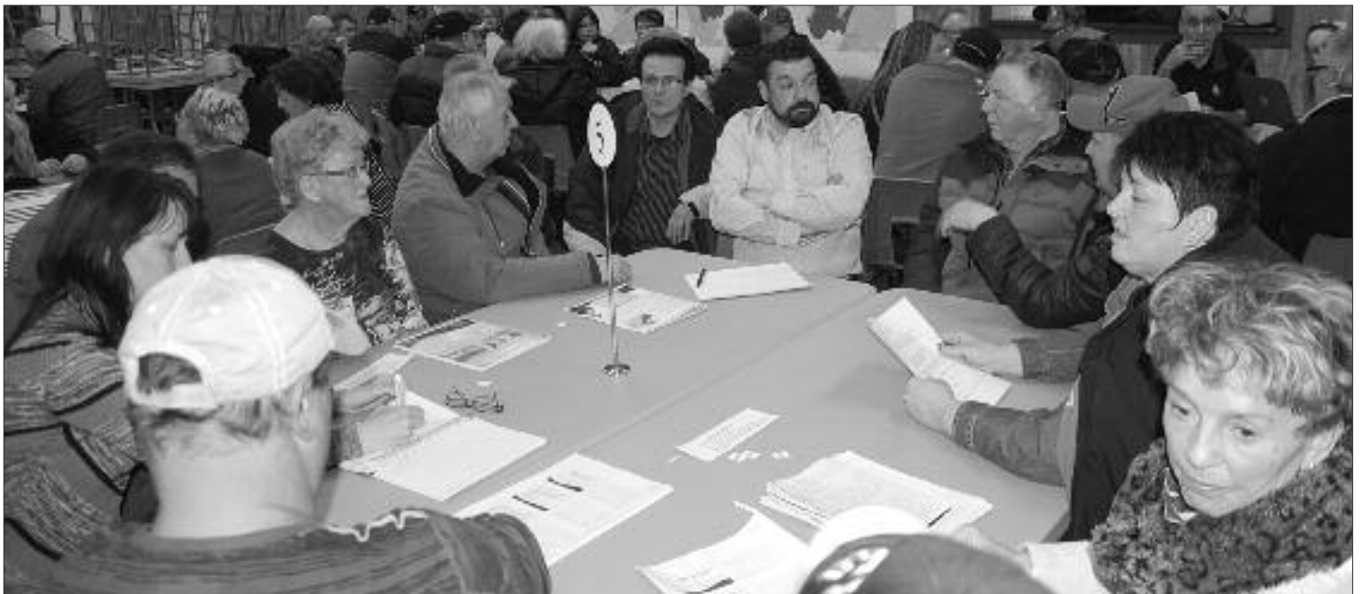
Les élus de Le Goulet, reunis autour d'une table de discussion.

L e lundi 21 mars dernier, de nombreuses personnes se réunissaient à la Salle communautaire de Le Goulet pour être informées sur le projet de regroupement et aussi s'exprimer sur le sujet.