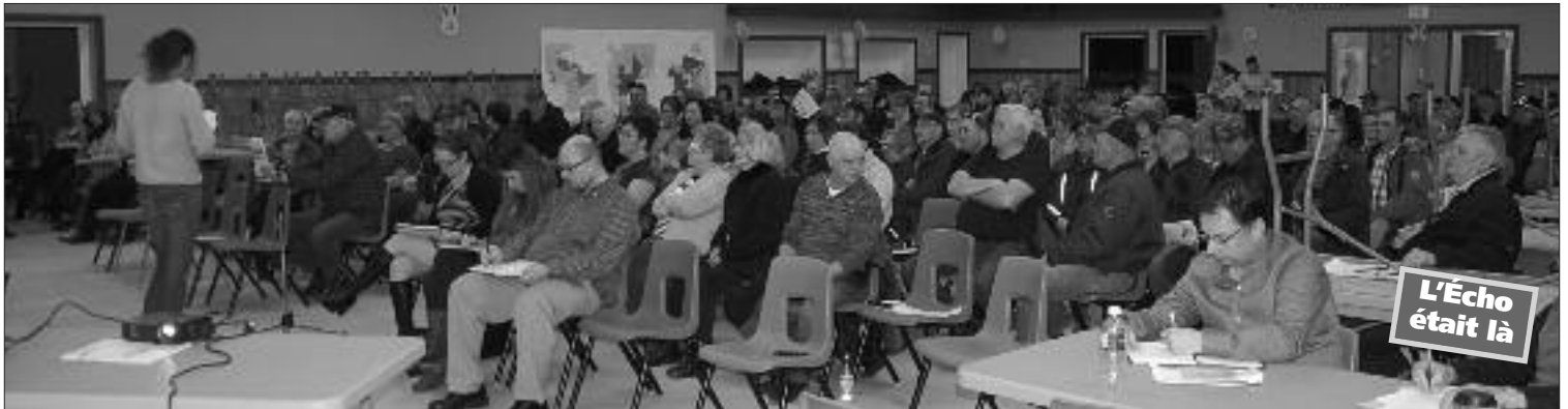
À la salle de communautaire de Le Goulet le 21 mars dernier on parlait de regroupement.