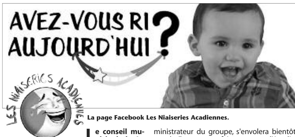
La page Facebook Les Niaiseries Acadiennes.

Le conseil municipal de Le Goulet félicite le groupe Facebook humoristique Les Niaiseries Acadiennes qui a remporté le prix Atlantique du Consulat général de France pour la promotion du fait français en Acadie auprès des jeunes.