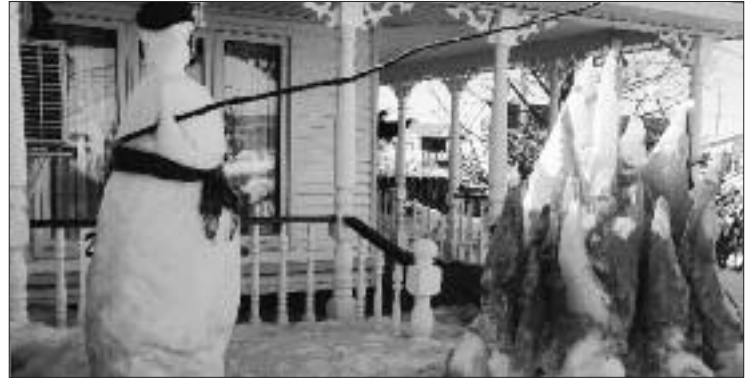
Les sculptures du Festival.