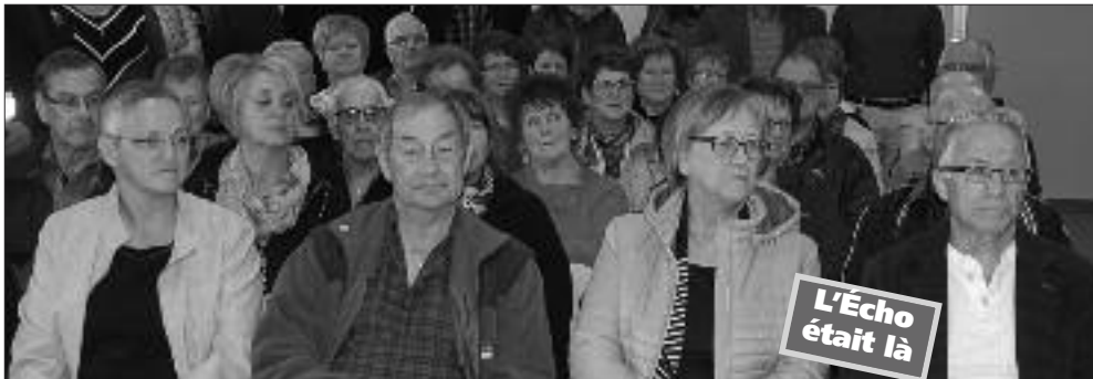
Notre maire était aux premières loges pour représenter Le Goulet lors de l'inauguration de l'hôtel de ville de Lamèque. Invité par la ville de Lamèque, il faisait partie des invités d'honneur en compagnie d'autres maires de la Péninsule acadienne.