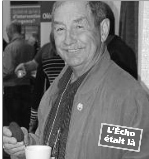
Notre maire assistait au congrès durant la fin de semaine afin de rapporter l'information au conseil.

Durant le dîner du samedi, l'Honorable Pierrette Ringuette, sénatrice représentant le Nouveau-Brunswick au Sénat canadien, s'exprimait sur le Projet du centre de commercialisation et d'exportation du Canada Atlantique.