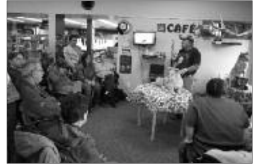
On parle animaux!