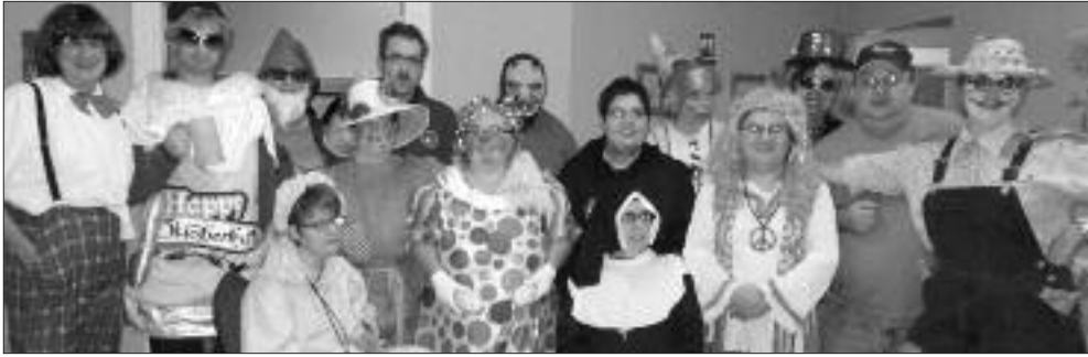
Déguisés pour le party d'Halloween au Club de l'âge d'or de Grand-Sault.