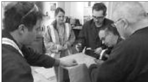
Fabrication de la cabane à oiseaux.

Le mercredi 21 octobre 2015, des étudiants du Collège Communautaire du Nouveau-Brunswick d'Edmundston sont venus passer une journée à l'Atelier des Copains de St-