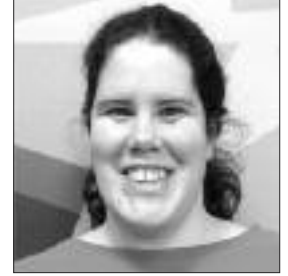
Par Marie-France Albert