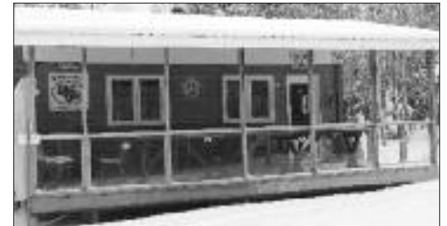
Le Refuge à Clarence.

J'ai beaucoup aimé ce livre parce qu'il y a beaucoup de citations qui nous portent à réfléchir. Par exemple : « Vivez votre journée comme si c'était la dernière ». □