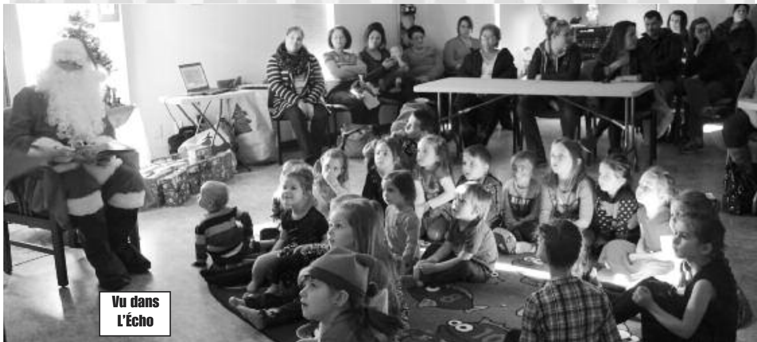
Vu dans L'Écho