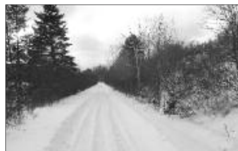
Tous nos sentiers d'hiver sont surfacés ou grattés.