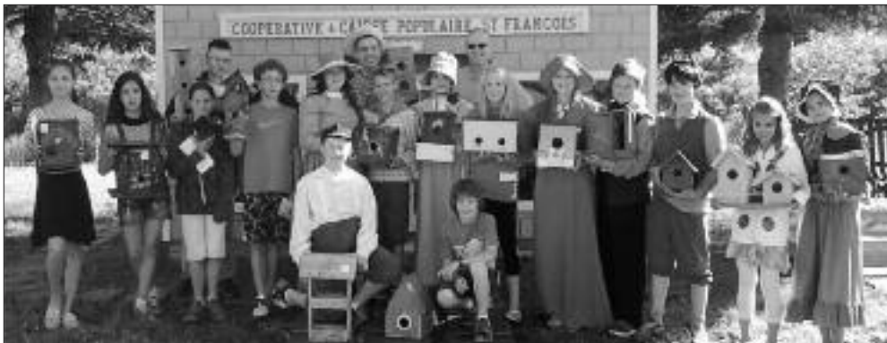
Les élèves de 5, 6, 7, et 8e année.

Le mercredi 17 juin dernier, les élèves de l'école Ernest Lang visitaient le site de Ledges. L'invitation de faire des cabanes à oiseaux pour les installer sur le site avait été lancée en octobre. À notre grande surprise 33 élèves y ont participé.