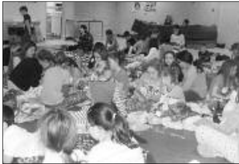
Campington, soirée bingo, et film.