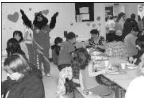
La mascotte de l'école, Flammèche, lors du déjeuner de la Saint-Valentin.