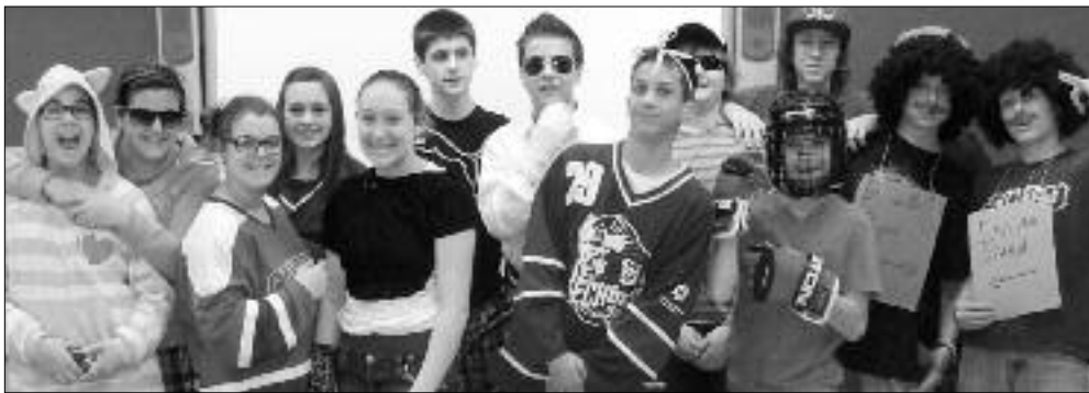
Une journée pas rapport.