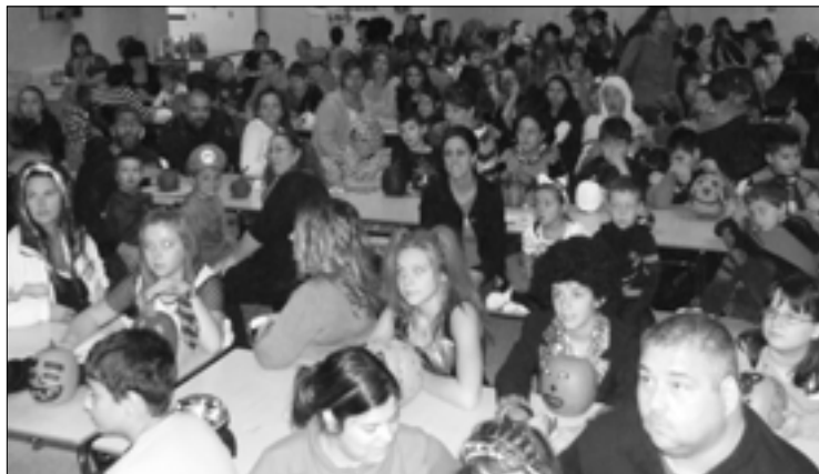
Les participants à la journée d'Halloween.