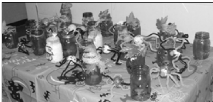
Des oeuvres d'Halloween, des classes d'art de la 4e à la 8e année.

U ne école en action, c'est le cas de le dire. Chaque mois, les jeunes ont l'occasion de participer à divers événements. Octobre, n'a pas fait exception puisqu'une soirée dansante accueillait plus de 150 jeunes de la région, venus se divertir.