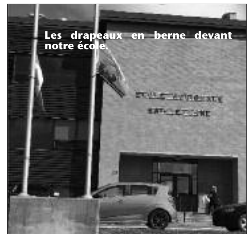
Les drapeaux en berne devant notre école.

Les funérailles avaient lieu à l'église catholique St. Bernard à Moncton. Un défilé d'agents en uniforme quittait le boulevard Assomption pour aller à l'église. La GRC encourageait les citoyens à se réunir le long du trajet du défilé afin de montrer leur soutien à la