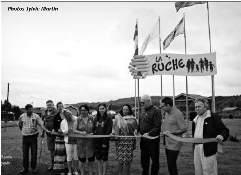
La coupe du ruban en présence du maire, des conseillers, de la sénatrice Ringuette, du député Arseneault et du curé.

M algré une petite pluie, Ste-Anne-de-Madawaska procédait à l'ouverture officielle le 1er juillet dernier du tout nouveau parc d'eau nommé La Ruche.