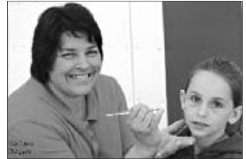
On se maquille pour la fête!