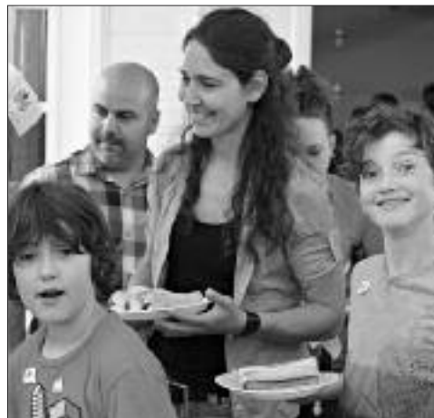
Hum, de bons hot-dogs!

Vous êtes responsables d'un organisme à but non-lucratif, vous pouvez nous faire parvenir vos coordonnées pour être ajouté dans cette liste à : www.textes@echosnb.com