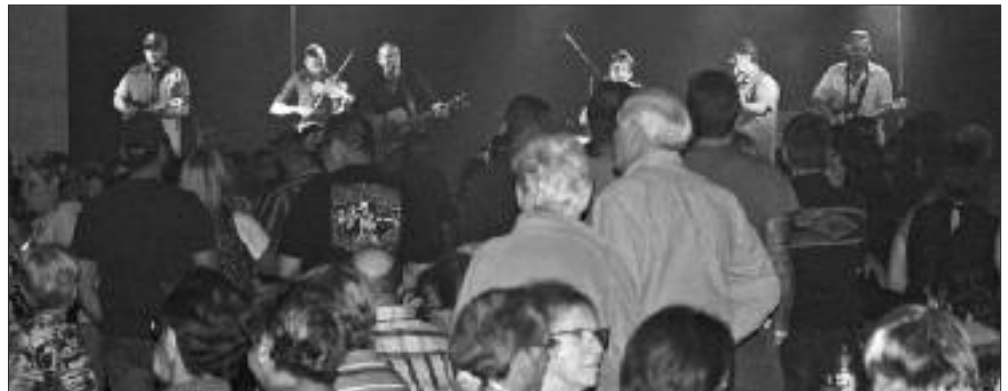
Le groupe Réveil devant une salle comble.