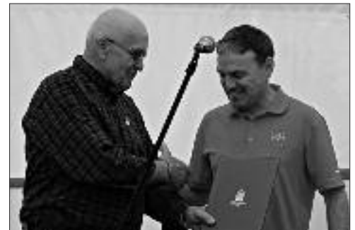
Notre maire et le député fédéral René Arseneault.