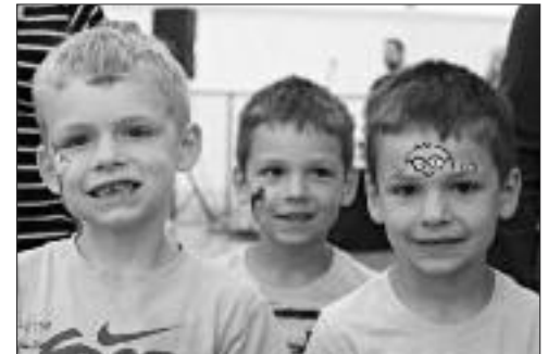
Nous aussi on est maquillé pour la fête!