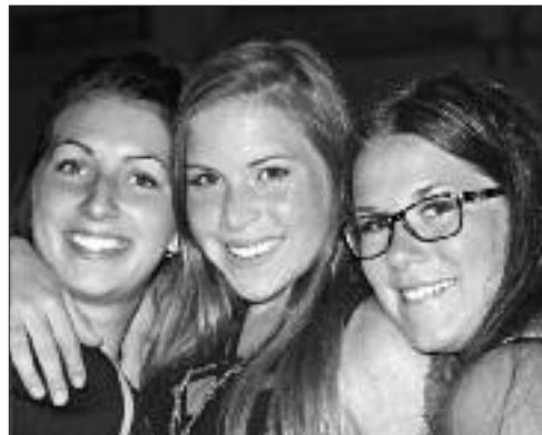
De jeunes spectatrices appréciant leur soirée.