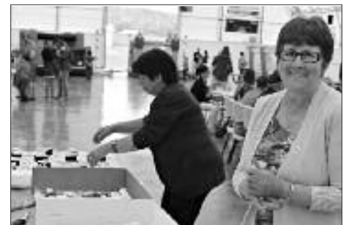
Du bon gâteau pour se sucrer le bec!