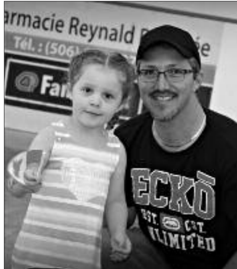
Une jeune canadienne et son père, venus célébrer avec la communauté.