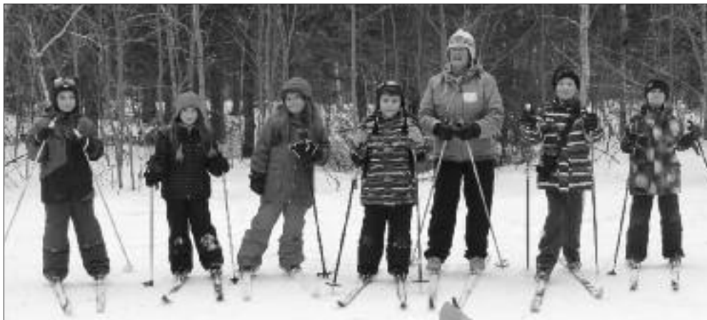
Des jeunes profitant de la semaine de relâche pour pratiquer le ski de fond au Club des Gailurons.

M aintenant que le Club de ski de fond les Gailurons fait partie de la nouvelle municipalité régionale, il a pu compter sur le support financier de la Ville de Grand Tracadie-Sheila. L'aide apportée permettra de subvenir aux besoins d'opérations de base du Club. Nous voulons exprimer nos remerciements les plus sincères au conseil municipal et à son département de loisirs et de mieux-être.