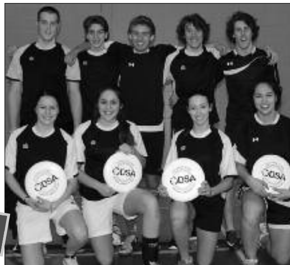
L'Équipe de frisbee de WAL, championne des JESPA 2013.

De courte durée, la cérémonie aura tout de même réuni une centaine de personnes (joueurs, entraîneurs et parents).