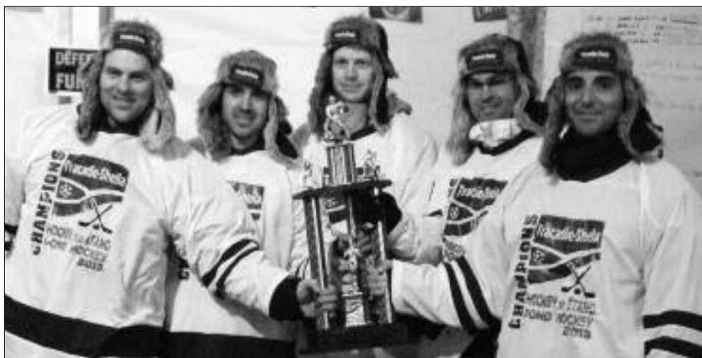
L'équipe gagnante (compétition) les Acadian Boys.

M ême si la température était froide, les participants avaient chaud à jouer au hockey sur étang à la fin de janvier. Un spectateur disait : « C'était tellement plaisant de voir toutes ces 26 équipes jouer dehors comme des enfants ».