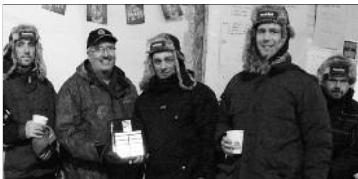
L'équipe gagnante (récréatif) Coors Light.

Notre équipe locale faisait également belle figure au tournoi de Plaster Rock au début de février. Cette année, une seule équipe féminine participait mais on peut déjà prévoir que l'an prochain, il y aura plusieurs autres équipes qui viendront jouer... sur l'étang. □