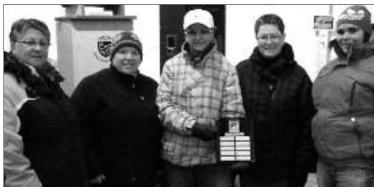
L'équipe féminine MQM du tournoi.