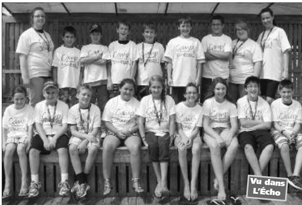
Jeunes du Camp Entrepreneurship Jeunesse de Tracadie-Sheila.

Cet été, Entreprise Péninsule a présenté pour une deuxième année le Camp Entrepreneurship Jeunesse, un camp pour les jeunes de 9 à 12 ans.